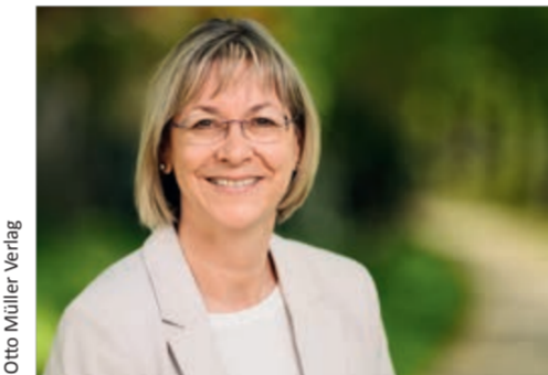
Otto Müller Verlag